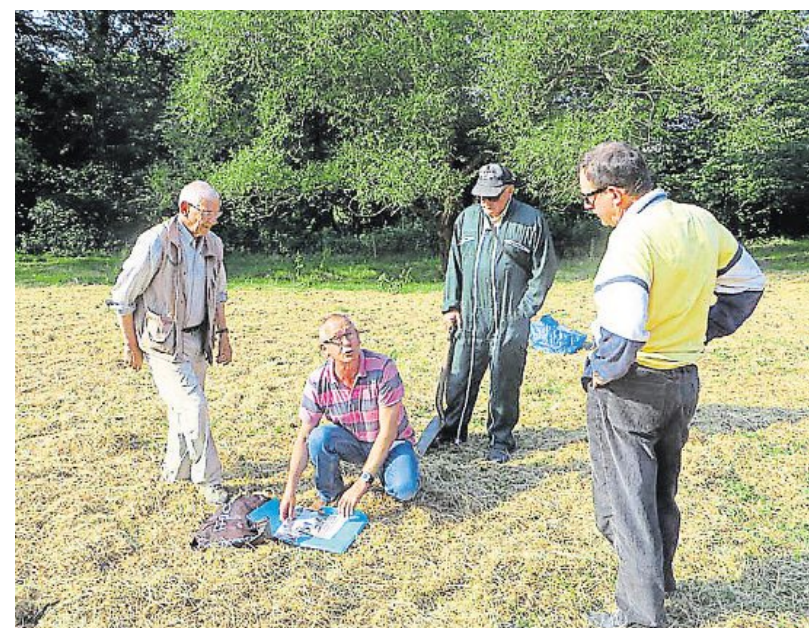
L'association Renaissance du Haut-Gesvres veut réhabiliter la fière bâtisse.

(1) Treillières, un village en Pays nantais : 1800-1945 , Jean Bourgeon, 420 pages, éditions Coiffard (2012).