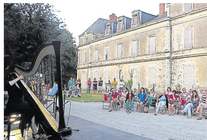
À l'initiative de l'association Renaissance du Haut-Gesvres, le site a accueilli un concert de harpe, début juillet.