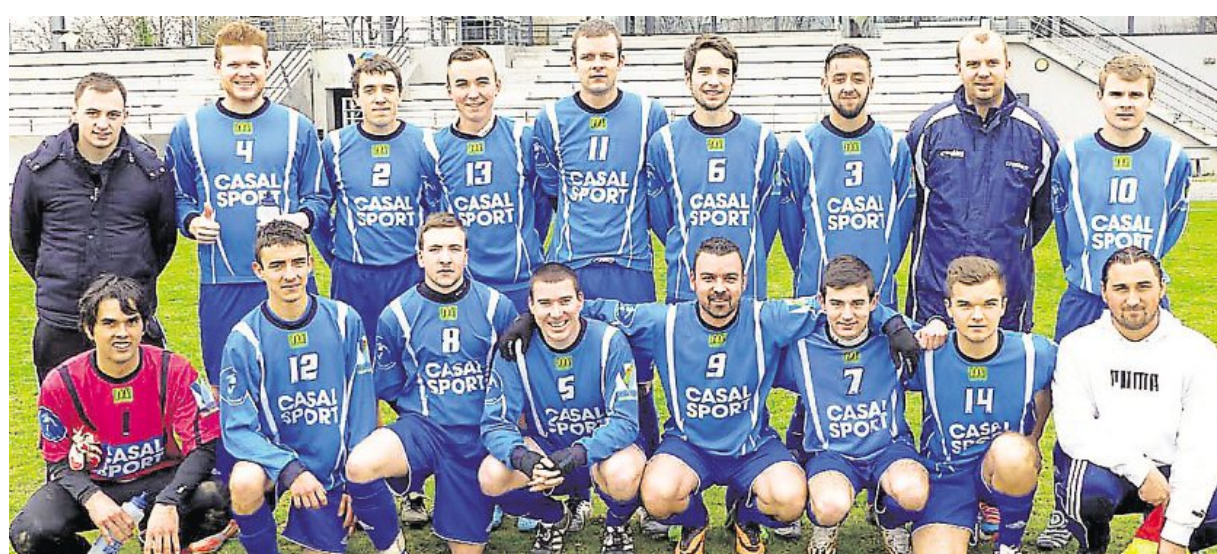
L'équipe des seniors C de l'ES Vigneux, qui a terminé première du groupe de 4 e division la saison dernière.

Pour réaliser ses objectifs, l'ES Vigneux va faire place aux jeunes. Une dizaine de joueurs montent de U18 seniors et le club a à cœur de se servir de cette génération pour donner une nouvelle dynamique au groupe