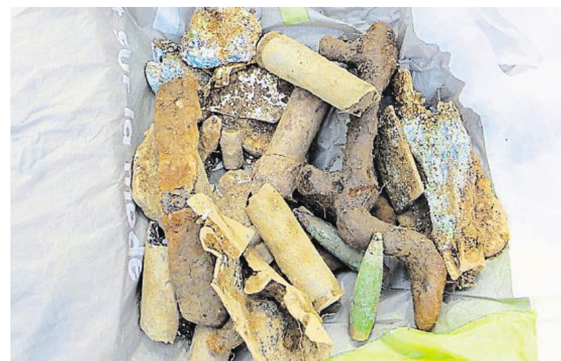
Dans une prairie attenante au Haut-Gesvres, le 15 juin 1944, un bombardier américain B17 s'écrasa après une opération sur Nantes. En juin 2014, des fouilles superficielles ont permis de mettre au jour des restes de munitions et des débris métalliques.