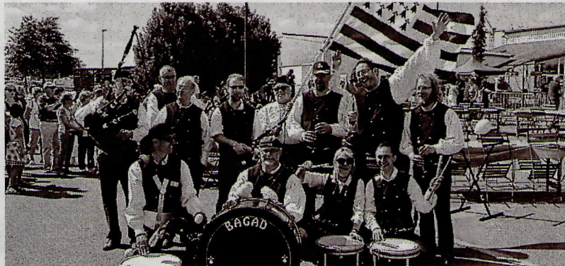
Samedi, le Bagad-Orvez (bagad d'Orvault), qui compte trois Treilliérains parmi ses sonneurs, sera au rendez-vous de cette édition de Château en fête.